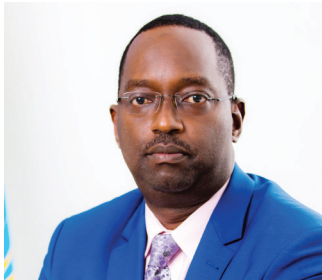
Dr. Daniel Ngamije

Ministre de la Santé de la République du Rwanda